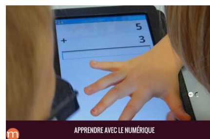
Apprendre et enseigner avec une tablette : une expérimentation au lycée