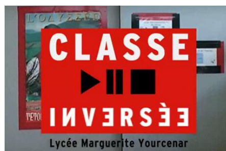
Apprendre autrement en classe inversée