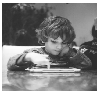
Enseigner avec le numérique à l'école primaire

Les web-documentaires de l'INSPE de Strasbourg