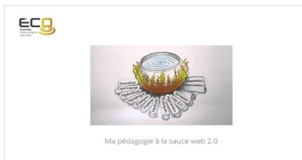
Ma pédagogie à la sauce web 2.0

Les web-documentaires de l'INSPE de Strasbourg