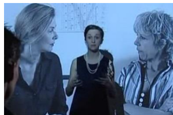
Effets de la catégorisation