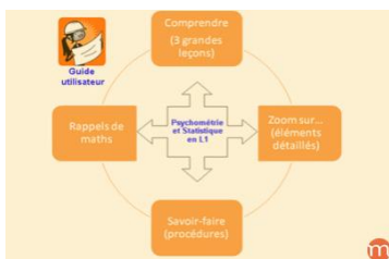
Psychométrie et statistiques