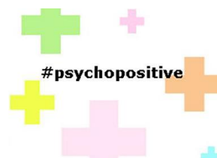
Introduction à la psychologie positive