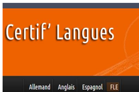
Certif'langues en FLE