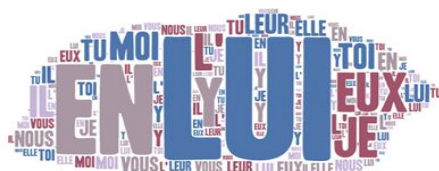
Les pronoms personnels du français