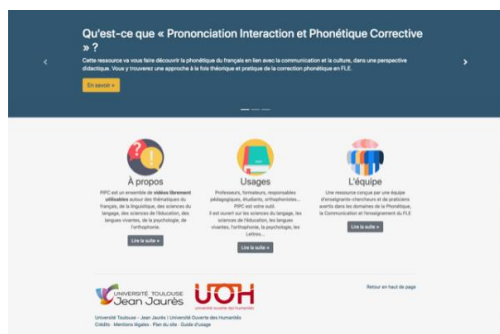
PIPC : Prononciation Interaction et Phonétique Corrective en FLE