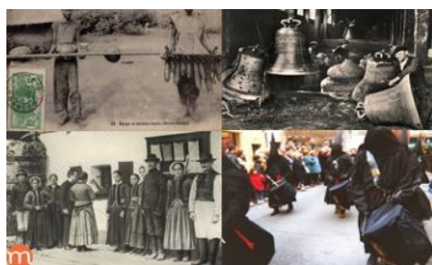
Sciences et religions à l'époque contemporaine

Sciences et religions aux XIXe et XXe siècles