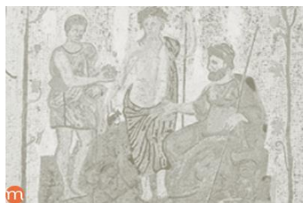
Religions et représentation figurée

La représentation figurée dans les religions