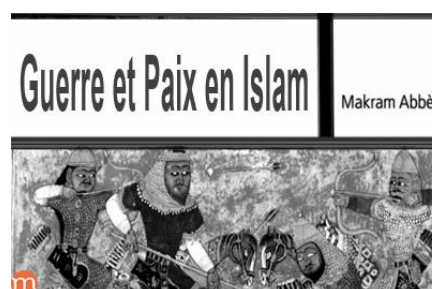
Guerre et paix en islam