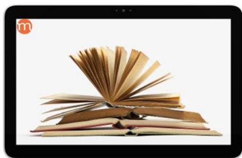
Politique, religions et constructions étatiques (XIe-XVIe/XIXe siècles)

Politique, religions et constructions étatiques